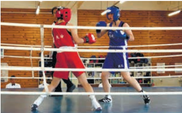
部活動：ボクシング