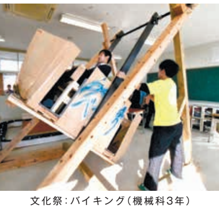
文化祭：バイキング（機械科3年）