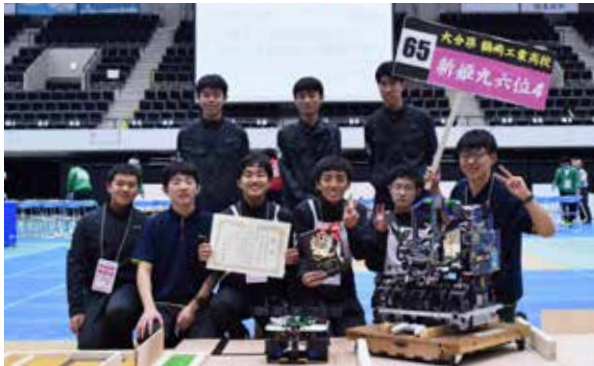
部活動：全国ロボット競技大会（電気部）