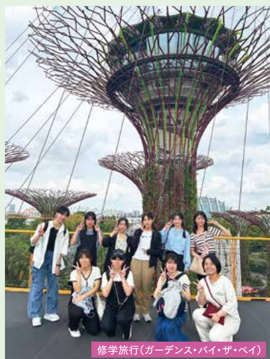
修学旅行(ガーデンズ・バイ・ザ・ベイ)