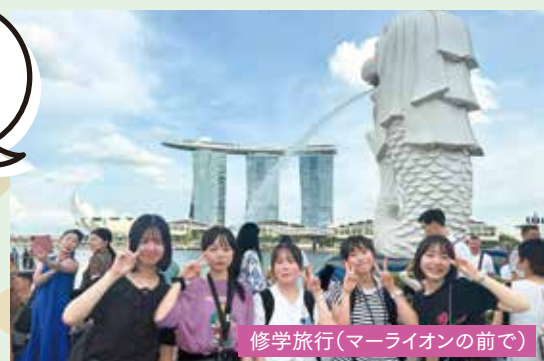
修学旅行(マーライオンの前で)