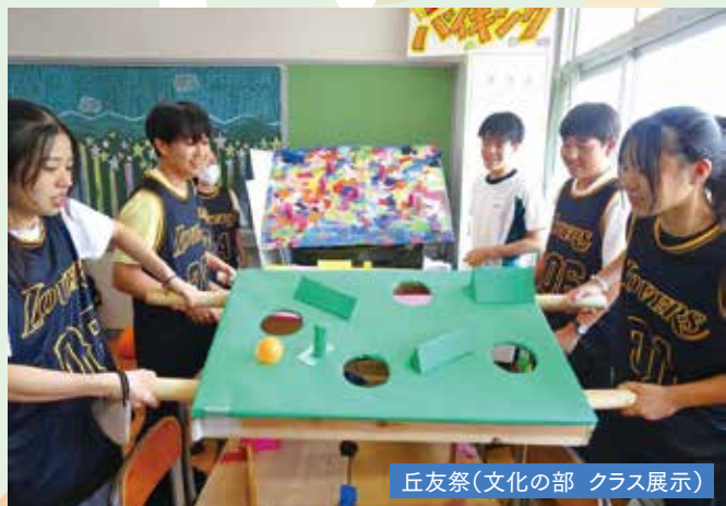
丘友祭(文化の部 クラス展示)