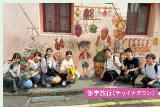
修学旅行(チャイナタウン)