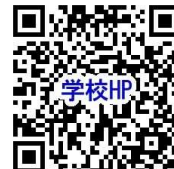
学校ホームページ