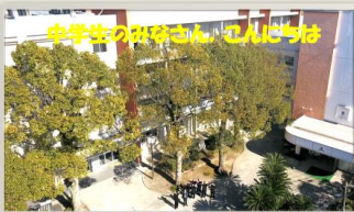
臼杵高校の魅力、紹介します!

中学校3年生の皆さん、いよいよ受験校決定ですね。皆さんの大切な選択です。納得のいく受験校決定をして、合格目指して頑張りましょう。中学校で行った高校説明会のスライドから、<臼杵高校の魅力>もう一度のぞいてみます。