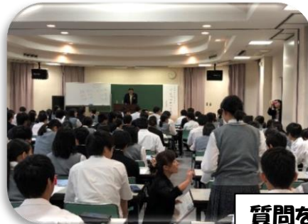
質問をする生徒たち