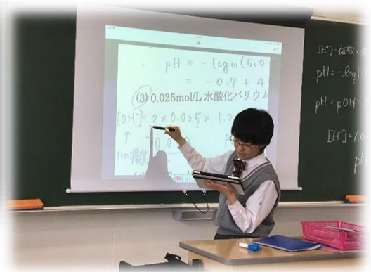
iPad と電子黒板を使って、自分の考えを説明