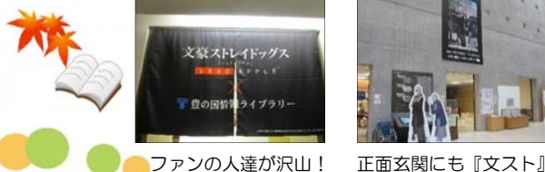
ファンの人達が沢山! 正面玄関にも『文スト』

先月号の「四次元ポケット」で紹介したコラボ企画のイラスト募集。 鶴工生(名前は出ていませんが) の作品も会場に展示されています! 参加希望の方は図書館まで* 会場:大分県立図書館1階 第1研修室