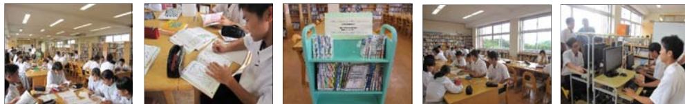
本を読んで情報収集! 「汚染」と「汚濁」の違いは? 大分県立図書館の本☆ どうやってまとめる? iPadやPCも上手に活用