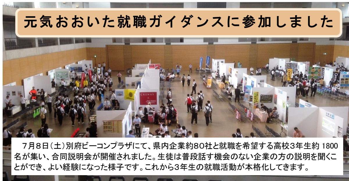
7月8日(土)別府ビーコンプラザにて、県内企業約80社と就職を希望する高校3年生約1800名が集い、合同説明会が開催されました。生徒は普段話す機会のない企業の方の説明を聞くことができ、よい経験になった様子です。これから3年生の就職活動が本格化してきます。