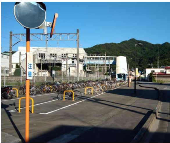
右側：被害を受けたばかりの津久見駅