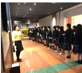
サッポロビール工場 見学の様子