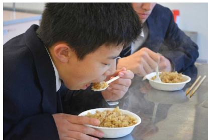
食う(寝る?)子は育つ(藤本)