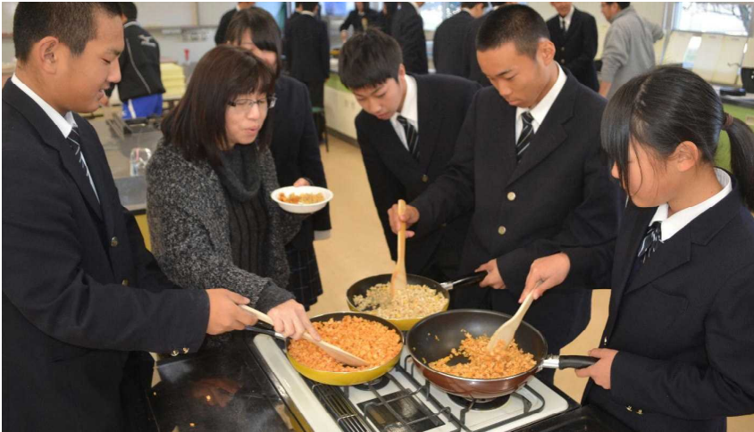
「どれどれ、3色いって(試食)みましょうかねえ」(桐谷先生)