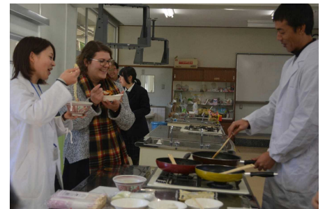
「英語ではフライドライスです」(ホーリー先生)