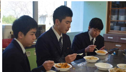
「ぼくも食べ過ぎました」(高嶋)