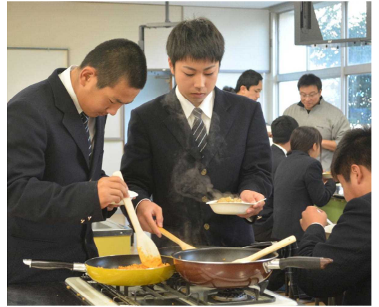
(湯気がいかにも出来たて、アツアツ)