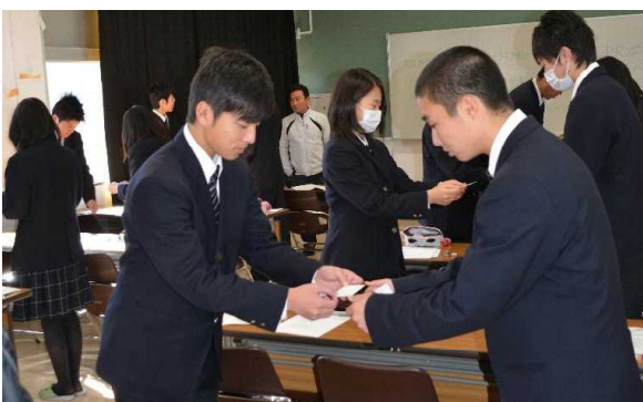
両手で 目下の者から 相手の表情を見ながら