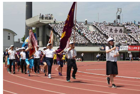
西高選手団の見事な行進！

6月3日(土)～5日(月)にかけて各競技において熱戦が繰り広げられ、西高は「陸上競技(女子)、体操(女子)、ソフトボール(女子)、なぎなた」の4競技が優勝しました。インターハイ・九州大会に出場する選手の活躍を期待するとともに2年次生主体となる新チームがスタートした部も次の大会へ向け頑張りたいと思います。