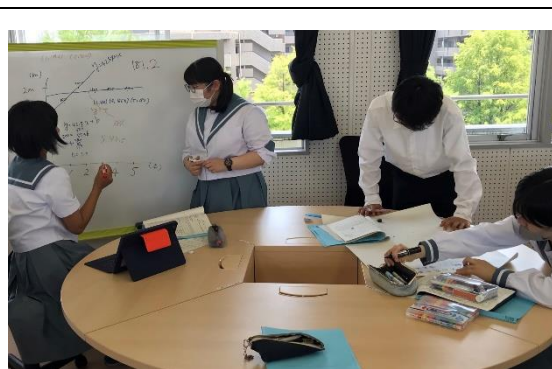
実験結果の分析・数理モデルの作成