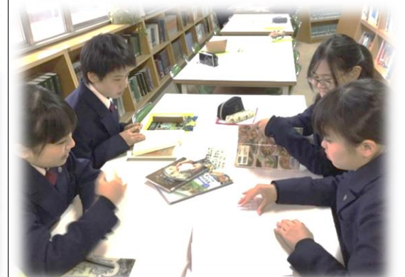
本やインターネットを用いて調べ学習も行っています