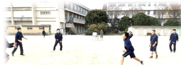
男子ドッジボールの様子

総合優勝は1学期に続き、 1年5組 でした。3学期にもクラスマッチはありますが、新年最初のクラス同士の戦いは、1/10の新春行事(百人一首大会)です。さあ、次はどのクラスが優勝を手にするでしょうか。32期の皆さんの真剣な取り組みを期待しています。