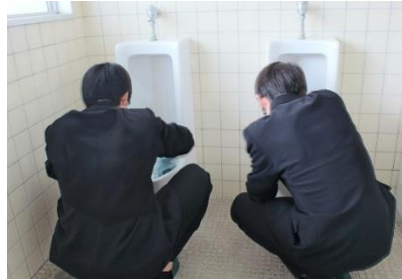
手磨きのトイレ掃除