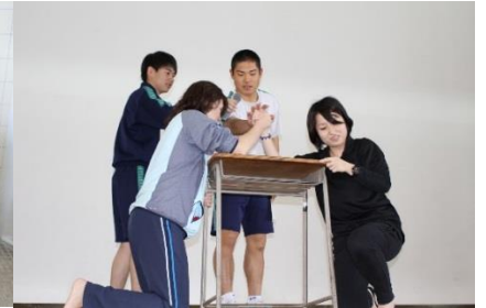
歓迎遠足の一場面