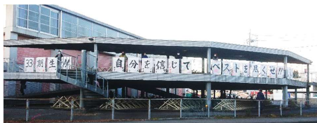
16日朝 出発時の激励

大学入学共通テストでは、「知識の理解の質を問う問題や、思考力、判断力、表現力を発揮して解くことが求められる問題を重視する」などが掲げられており、昨年までと比べ、どのように変化するのが懸念されていました。実際の数学の問題を見てみると、公式をそのまま使うのではなく、公式の意味を理解し、その意味を利用しながら解法していくといった問題が多くなったと感じています。私たち教職員も、これからの社会（入試）の変化に対応すべく、研究を重ね、生徒の夢実現に努力してまいります。