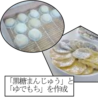
「黒糖まんじゅう」と「ゆでもち」を作成