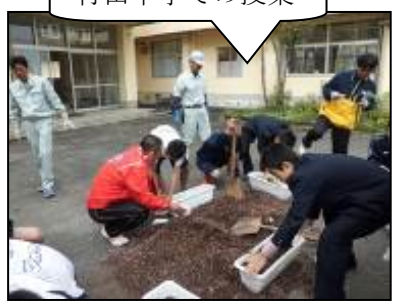
竹田中学での授業