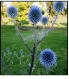
本校のヒゴタイの花