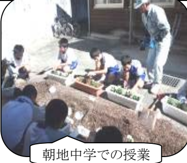
朝地中学での授業

農産物即売会(農場) 十...〇〇〇十三...〇〇 ○シクラメン・パンジー・鉢物・野菜 ○肉加工品・モチ米・焼き芋・焼き栗 など ○科展示(校舎2階) 十...〇〇〇十三...〇〇 ○バザー(前庭) 十...〇〇〇十三...〇〇 ○リサイクルショップ 十...〇〇〇十三...〇〇 ○もちまき大会(前庭) 十...〇〇〇十三...〇〇 ※シクラメンの入場抽選会は九時三十分から行います。