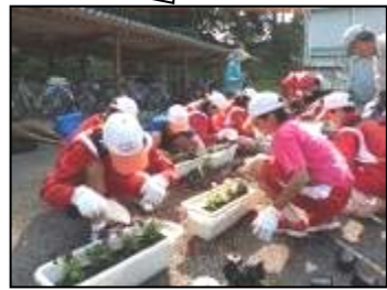
直入中学での授業

十月十四日から十七日の期間に、都野中学・緑ヶ丘中学・竹田中学・竹田南都中学・直入中学・久住中学・朝地中学で「パンジーの植付け」実習をしました。