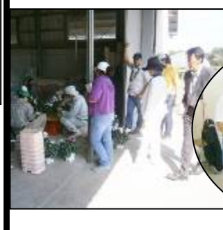
多くの質問を受けました