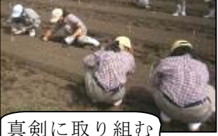
真剣に取り組む生徒たち