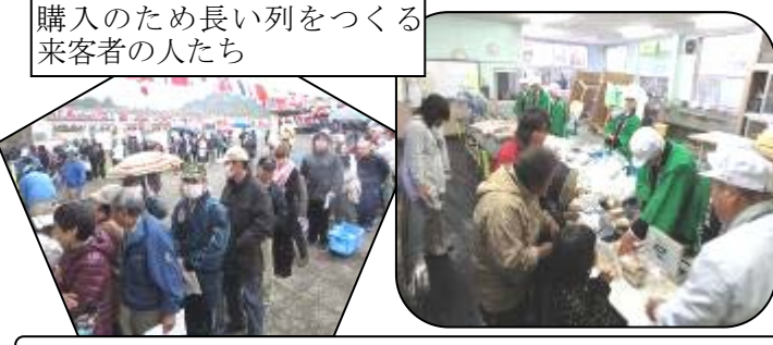
久住校は地域の人々に力強く支えられています!!!

十一月十七日(日)に学園祭が無事に終了しました。たくさんの方々に来ていただきありがとうございました。ありがとうございました。 PTAによる餅つき、同窓会の農産物や物品の販売、発動機の展示・精米販売、野球部保護者の会、トマトや花球根の販売などもありました。