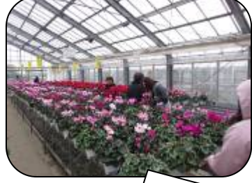
シクラメンが一番人気でした!!!