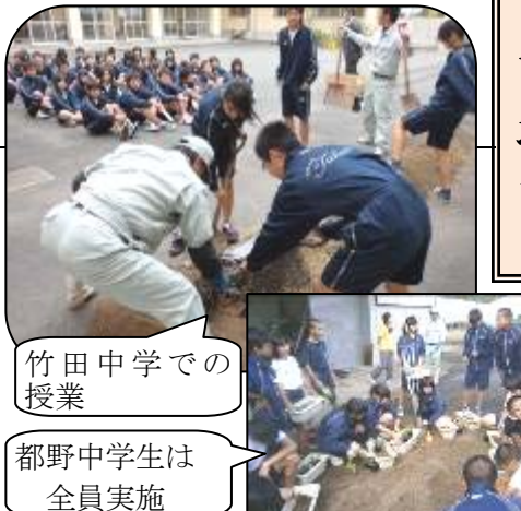
竹田中学での授業 都野中学生は全員実施

十月十一日から十月十八日の期間に、都野中学・緑ヶ丘中学・竹田中学・竹田南中部・直入中学・久住中学・朝地中学で「パンジの植付け」実習をしました。