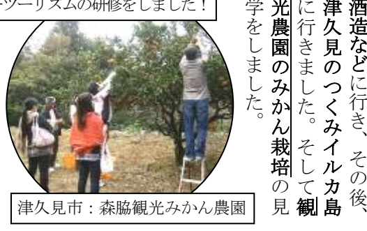
津久見市: 森脇観光みかん農園

十一月九日(土)に久住校PTA会員十六名で白杵津久見地域に研修に行きました。最初に白杵市の小手川酒造などに行き、その後、津久見のつくみイルカ島に行きました。そして観光農園のみかん栽培の見学をしました。