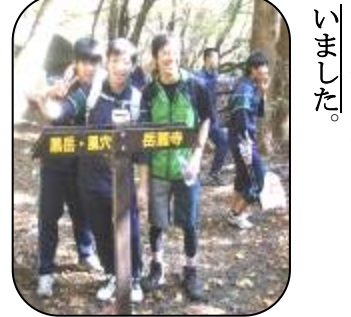
むこうに見えるのは大船山

途中の「風穴」から頂上までが急坂で大変でした。でも頂上に着いたときは皆、すがすがしさと満足感で一杯でした。ゴミは非常に少なかったのですが、生徒たちは登山道の周辺のゴミを拾いました。