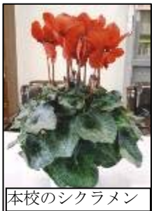
本校のシクラメン