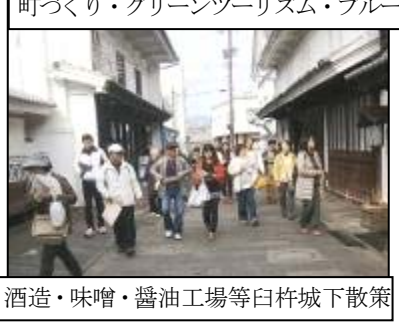
町づくり・グリーンツーリズム・ブルーツーリズムの研修をしました!