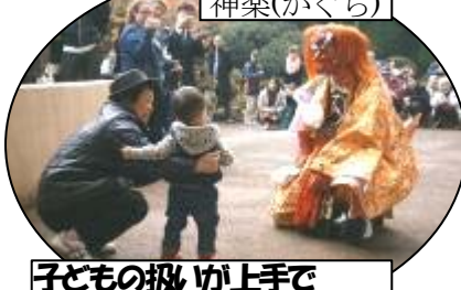
子どもの扱いが上手で昨年以上の腕前でした!!!