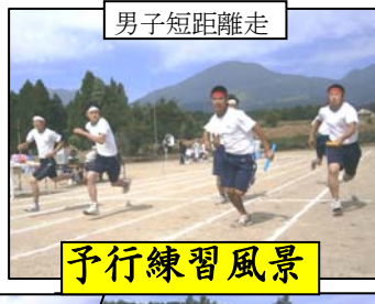
男子短距離走 予行練習風景