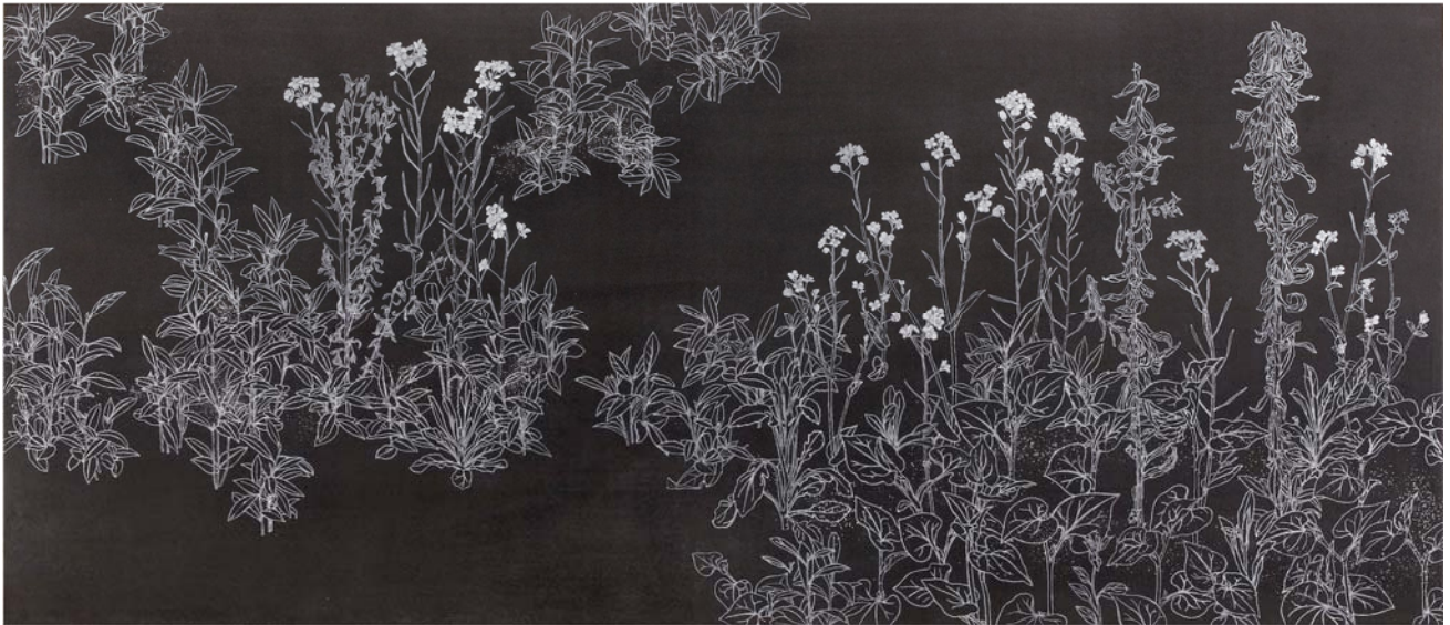
2012 年 ホルトホール大分緞帳デザイン原画 (780×1800mm)