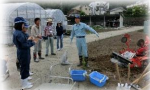
ファーマーズスクール (新規就農者が本校生徒と一緒に学習しています)

○数量に限りがありますので、早目にご来場下さい。 ○指定場所以外の駐車及び路上駐車はご遠慮ください。