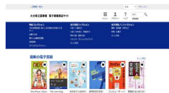
大分県電子書籍実証サイト

ぜひ借りて読んでみてください。貸出中の場合は「予約」の機能が使えます。この実証実験は県立図書館が次年度電子書籍を導入するかどうかの判断根拠となります。