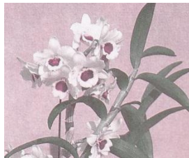
『花ことば』(池田書店)より

ギリシャ語の「樹木」と「生活する」が合体してデンドロビウムと呼ばれるようになりました。