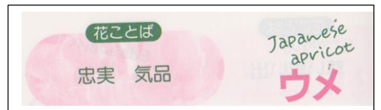
『花ことば』池田書店より