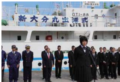
実習生代表あいさつ