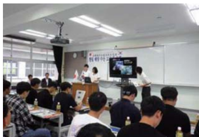
生徒会による学校説明