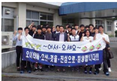
学校玄関での集合写真