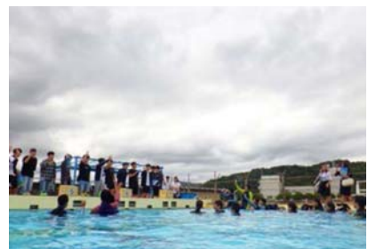
ダイビングの実習を見学

9月11日に韓国で潜水について学ぶ高校生たちが来校しました。生徒会のハングルを混ぜた学校紹介も熱心に聞いてくれ、その後の質疑応答も盛り上がりました。本校自慢の実習製品「おさかな小判」の試食や水深が3mある学校プールでのダイビング実習を見学して良い交流となりました。