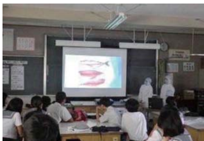
動画で説明する様子