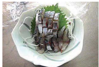
中学生が作ったお造り

10月3日に市外の中学校で本校2年生食品コースの生徒12名(男子3名・女子9名)がアジの三枚おろしを指導しました。事前に教える手順を考え、説明用の動画を準備した甲斐があり、中学生は上手に捌いていました。