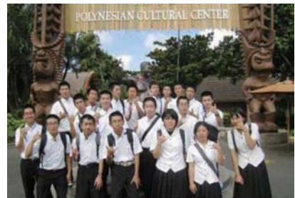
寄港地ハワイでの様子

10月3日に臼杵港で遠洋航海実習の出港式を行いました。海洋科2年生の航海・機関コースと専攻科1年生の30名が参加し、11月27日までの約2ヵ月間太平洋でマグロ延縄漁業実習や海洋観測を行います。洋上からの報告では、生徒たちは毎日元気に実習に取り組んでおり、魚の水揚げも順調なようです。新大分丸での遠洋航海実習はこれが最後となり、来年からは現在建造中の「翔洋丸」での実習となります。