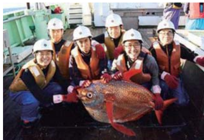
漁獲したアカマンボウ