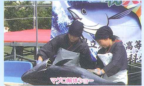
マグロ解体ショー