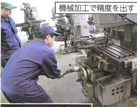
機械加工で精度を出す

担当の先生がタイムリーなアドバイスをしてくれて、とてもためになる実習で、この実習を通して、創意工夫の大切さや自主性・自発性、作品ができあがったときの達成感が味わえます。林工機械科ならではの実習です。