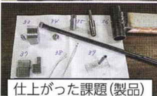
仕上がった課題(製品)