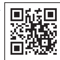
「コロナワクチンナビ」 二次元コード