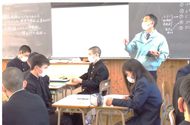
坂本先生による林業科1年生の授業風景

林工教職員が互いに授業参観を行い、改善すべき課題を共有して授業改善を図ることで、より良い授業を目指していくものです