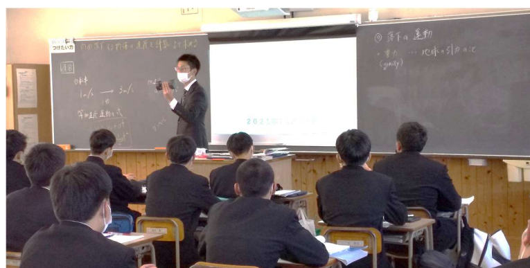
フレッシュな二人の授業風景