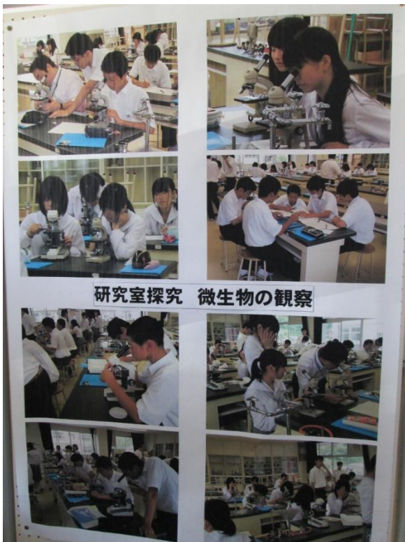
研究室探究 微生物の観察