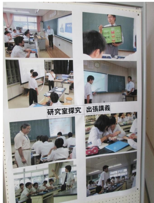
研究室探究 出張講義