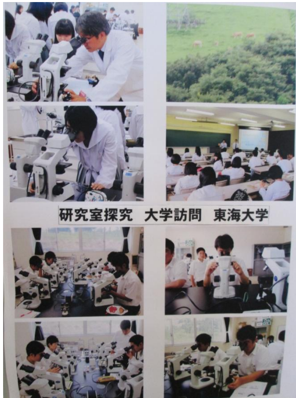
研究室探究 大学訪問 東海大学