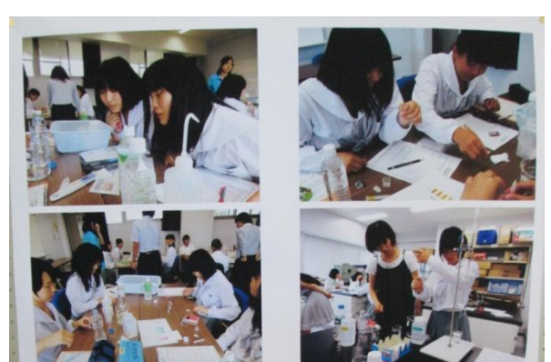
研究室探究 大学訪問 大分大学