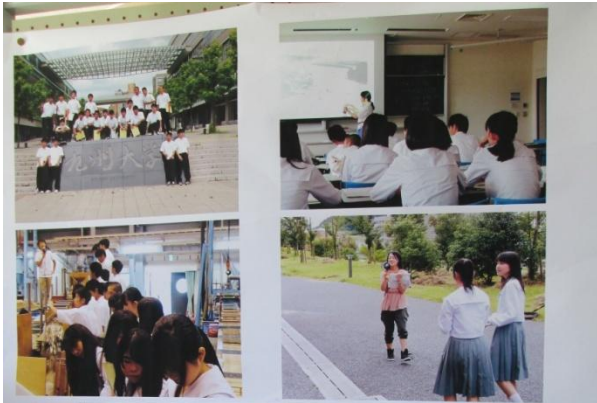
研究室探究 大学訪問 九州大学