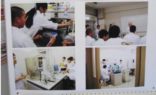
近畿大学産業理工学部 河津先生のご指導による「生体機能性材料研究」