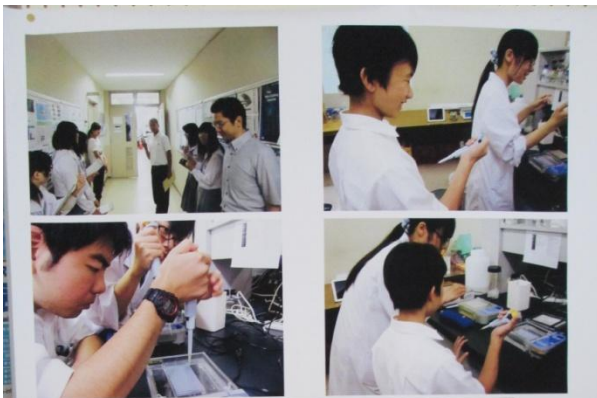
研究室探究 大学訪問 近畿大学