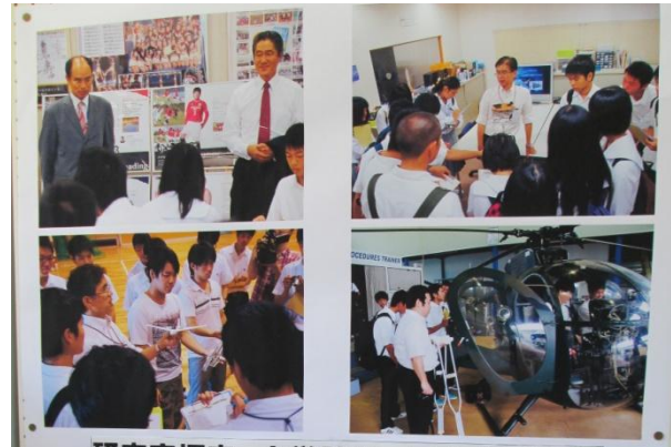
研究室探究 大学訪問 日本文理大学