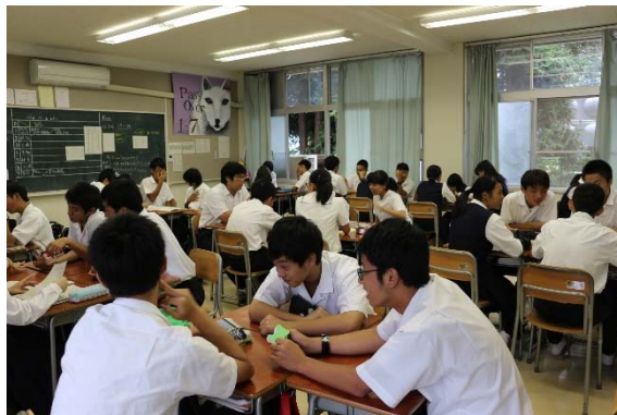
グループ別に分かれて協議